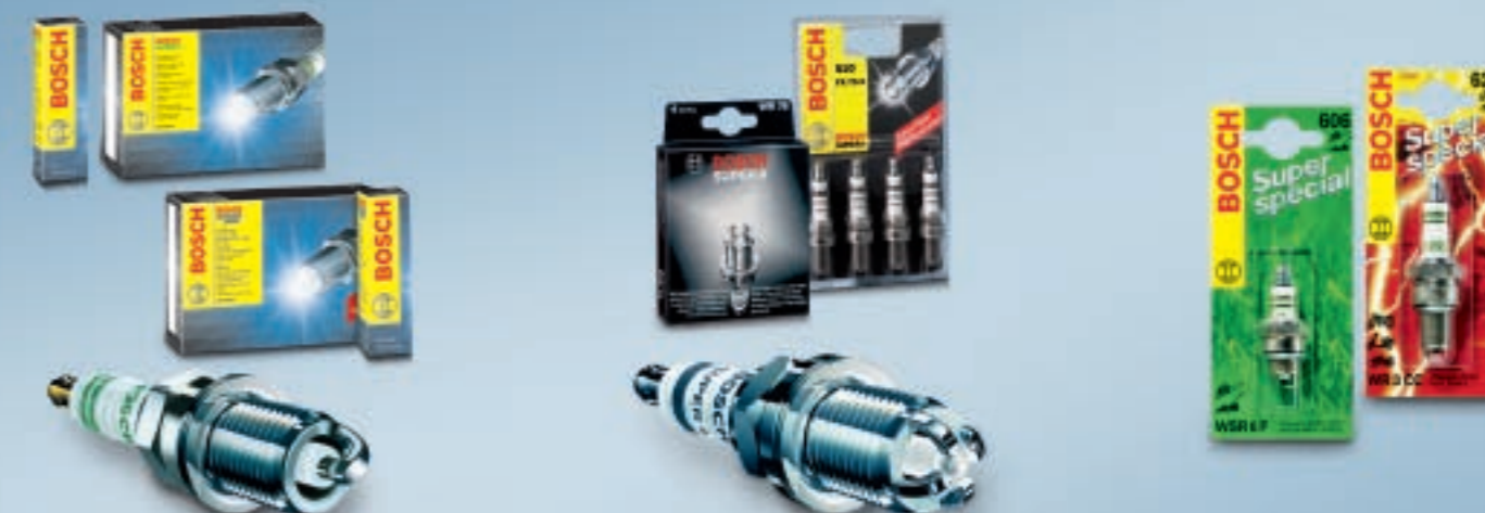
Bosch Super / Super plus