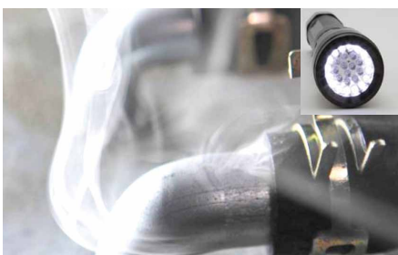
Weißes Licht lässt Abgase erkennen

Es kann aber auch ein, auf 7 bar voreingestellter, Stickstoffregler zur Verwendung mit größeren Stickstoffflaschen in der Werkstatt bestellt werden. Zum Anschluss an den SMT 300 wird dann ein Zylinderschlauch benötigt, der ebenfalls separat bestellt werden kann.