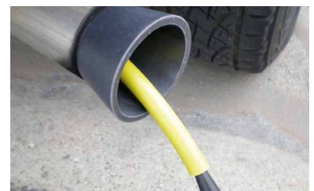
Leakfinder kann auch Undichtigkeiten im Auspuff-System finden